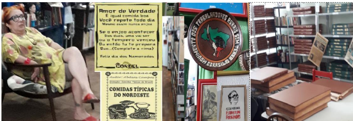
Figura 4 - Adelaide Gonçalves no seu espaço, e aspetos icónicos das salas do PLEBEU, terminando na sala que contém um arquivo dos jornais de Fortaleza

Entrando então pela porta do elevador da Figura 3, deparamo-nos com a ANTECÂMARA (01), que é a ‘sala de estar’ de Adelaide. Percorrendo clockwise as salas 1, 2, 3, tirámos fotos como as da Figura 4, onde surgem alguns ‘cordéis’ em que o ‘amor’ se associa à comida (com receitas de pratos nordestinos) e outros objetos relativos às memórias de Adelaide.