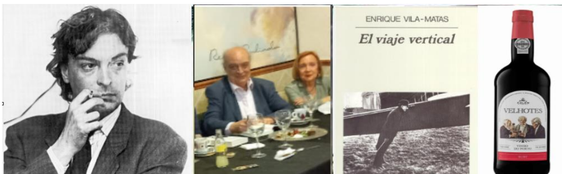
Figura 2- Vila-Matas com a sua musa e com o seu Vinho do Porto

Este catalão inventado, quando tendia para a idade mayor , percorria em ‘estado de graça’ as cidades onde trabalhara anteriormente, armado só de um caderninho onde legendava tudo o que lhe despertava o interesse, por exemplo, o rótulo do Vinho do Porto da marca VELHOTES, cuja degustação lenta lhe dava um extraordinário prazer (Figura 2).