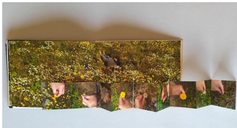
Figura 6. omitido, campo a mar , caderno primavera, 2024.

O meu trabalho artístico é autobiográfico e também se sustenta na Teoria das Cinco Peles de Hundertwasser, para suscitar outros modos de compreender a relação entre corpo, espaços e ideias. A união mulher e natureza é destacada pelo acompanhamento dos ciclos, tentando vislumbrar outras noções de tempo, pois cada processo tem seu próprio ritmo.