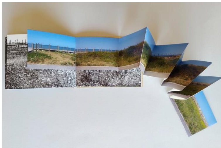
Figura 4. omitido, campo a mar , percurso cordão dunar, 2024.

Os elementos estruturais fundamentais de um livro são a finitude e a sequência. A sequencialidade da leitura direciona a interação do leitor, na ação do virar de página, que desperta o início de uma percepção, e na continuidade do folhear que conta tanto com a memória das páginas passadas quanto com a expectativa das páginas futuras.