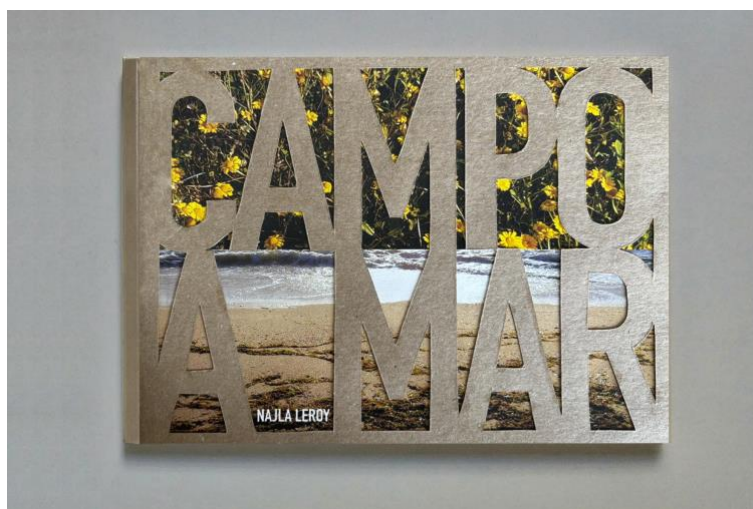
Figura 3. omitido, campo a mar , livro de artista fotográfico, 21x15cm, 2024.

O autor não é mais apenas o escritor, mas o responsável por todo o processo de criação e compreensão dessa estrutura que enfatiza o formato livro. As formas físicas e visuais são componentes fundamentais do significado tornando o de Livro de Artista como uma fusão específica de forma e conteúdo.