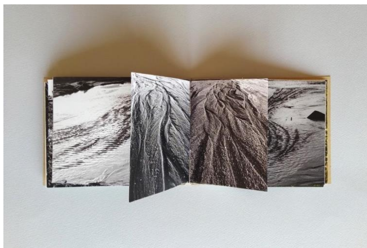
Figura 5. omitido, campo a mar , caderno verão, 2024.

A reprodução do projeto livro em formato e suporte que permitam difusão é um convite ao artista para se expressar e exercer o seu papel contemporâneo. O artista que concebe a publicação pode atuar de forma independente ou de forma colaborativa, integrando a capacidade técnica do autor, editor e designer, devido à diversidade dos processos até a obtenção do objeto final. Uma publicação de arte independente e autossustentável é um múltiplo democrático, uma forma da arte existir fora das estruturas das galerias e museus (Drucker, 1995).