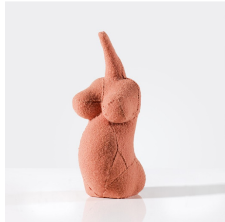
Louise Bourgeois Sem título, nº 22 de 36, da série, The Fragile 2007

A aproximação à fragilidade deve também prever a reparação – o retorno ao estado de “normalidade”. Se na fragilidade existe vulnerabilidade à transformação pelo exterior, para uma obra, um objecto, um ser, frágil, o que o deforma vem de fora. Mas a sua fragilidade resiste a esta ruína externa. A fragilidade como lugar de luta, um combate permanente, o caminho que permite compreender a condição humana.