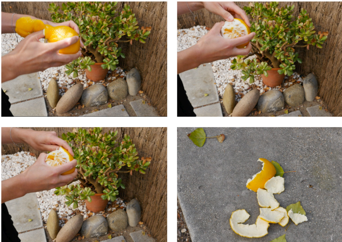
Joana Guedes Sem título, screenshots de filmagens. Porto Covo, Agosto 2021

As laranjas, evidentemente, descascam-se com as mãos.